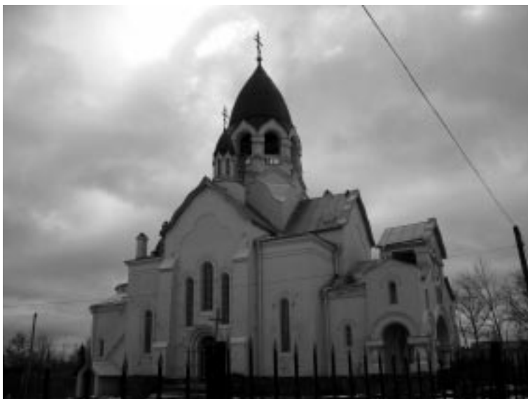
Храм Святителя Алексия в Тайцах