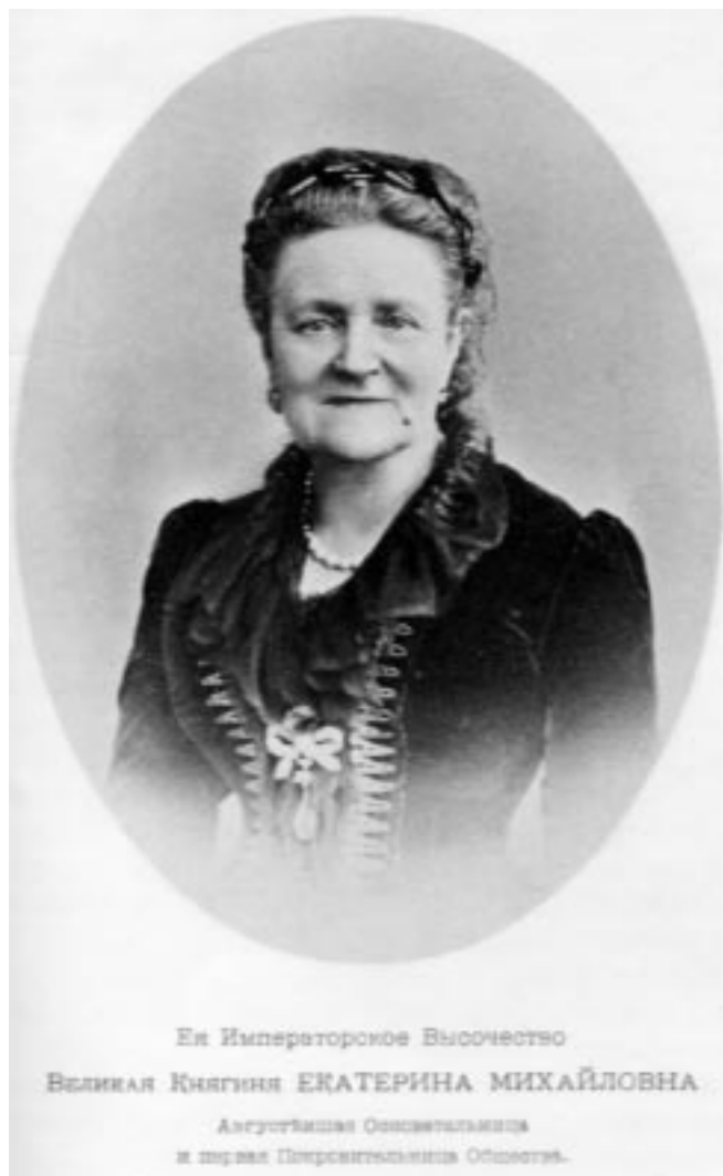
Ея Императорское Высочество Великая Княгиня ЕКАТЕРИНА МИХАЙЛОВНА Августышна Осветительница и первая Попечительница Общества.