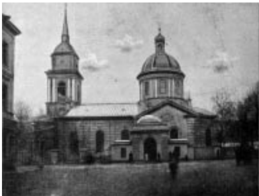
Церковь Покрова Пресвятой Богородицы в Большой Коломне