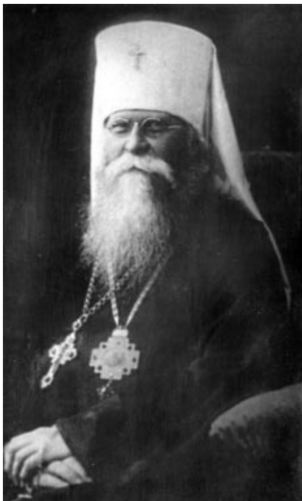
Митрополит Петроградский Иосиф (Петровых)