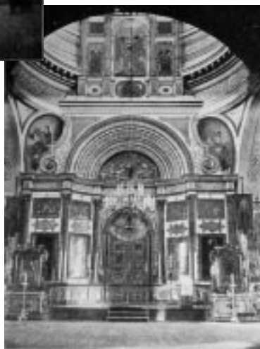
Внутренний вид церкви Покрова Пресвятой Богородицы в Большой Коломне