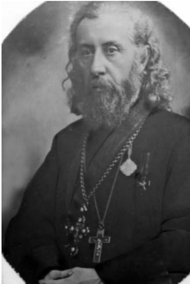
Протоиерей Димитрий Гаврилович (Любимов)