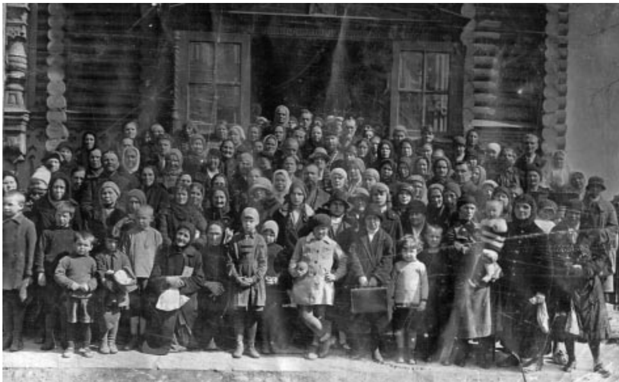
Иосифлянский храм и его паства. Предположительно, в Стрельне