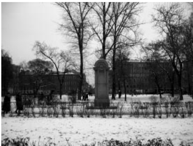
Бывшая Покровская, ныне площадь Тургенева, где находилась церковь Покрова Богородицы в Большой Коломне, уничтоженная в 1934 году