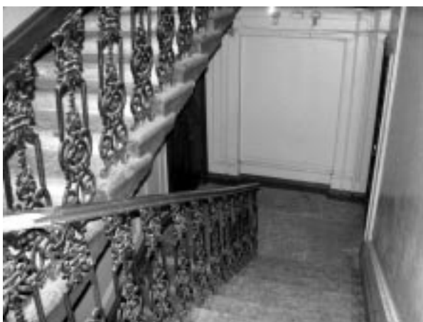
Дом в Санкт-Петербурге, где проживал протоиерей и затем владыка Димитрий, — улица Канонерская, дом 29, кв. 13