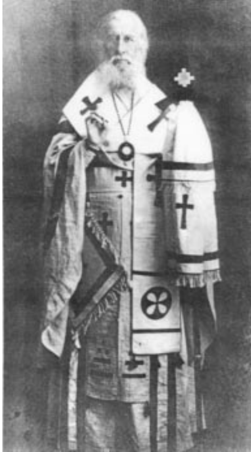
Владыка Димитрий в облачении